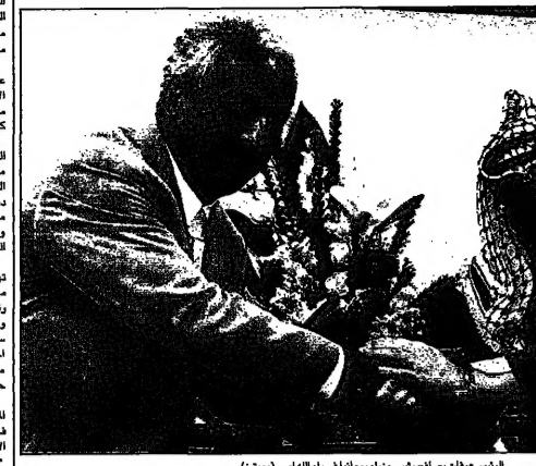
الرئيس عرفات يصاحبه وزيره وعضو المجلس الفلسطيني